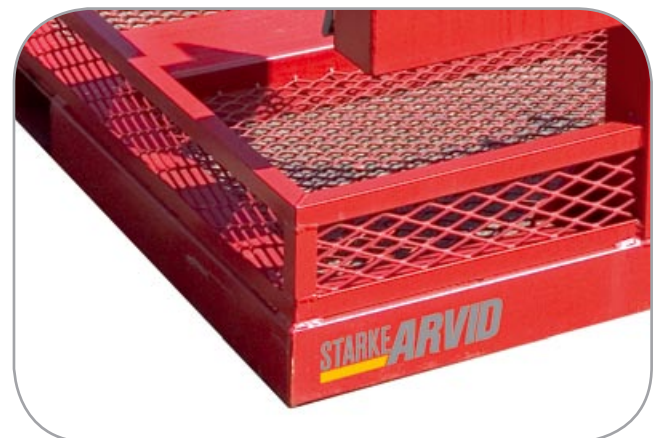
Strekkmall av ferdigbøyd armering i bunnen for sikrere transport