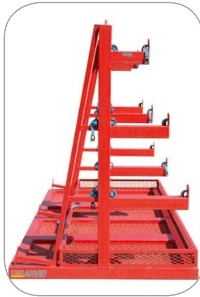
Kombistativ for armeringsnett og armeringsstang